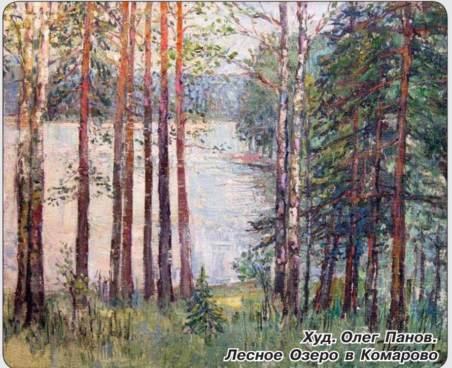
Худ. Олег Панов. Лесное Озеро в Комарово