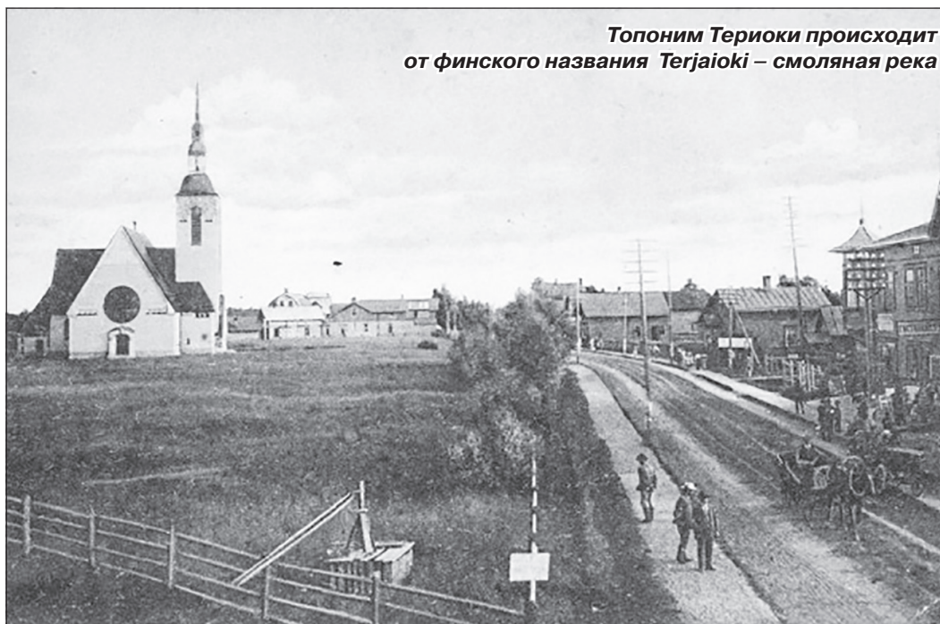
Топоним Териоки происходит от финского названия Terjajoki – смоляная река

Материал с сайта газеты «Вести Курортного района»