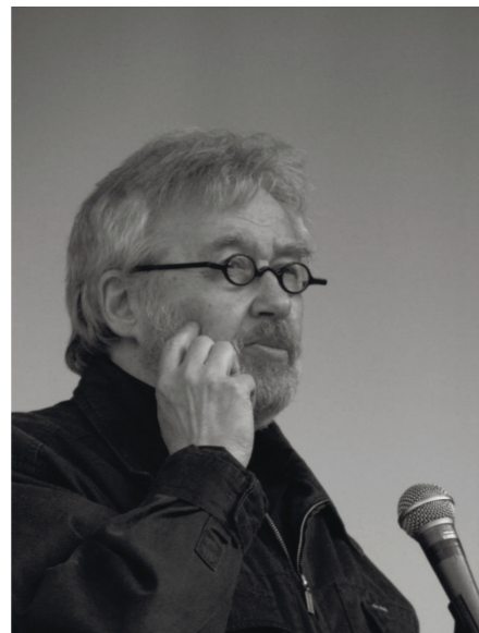
В. Рецептер на Ахматовском вечере в Комарово, июнь 2008 года

14 февраля отметил юбилей народный артист России, режиссер, основатель и руководитель Пушкинского театрального центра, писатель, литературовед и поэт, более 25 лет своей жизни посвятивший работе в БДТ —