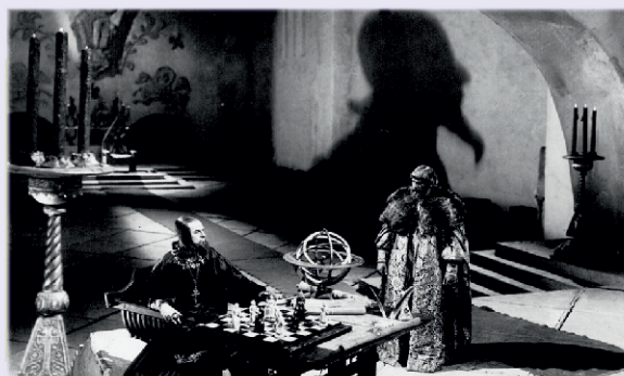
Кадр из фильма «Иван Грозный». Иван Грозный (Николай Черкасов) в Приемной палате. 1944 г.