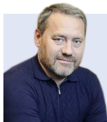
Председатель Законодательного Собрания Санкт-Петербурга Александр Бельский